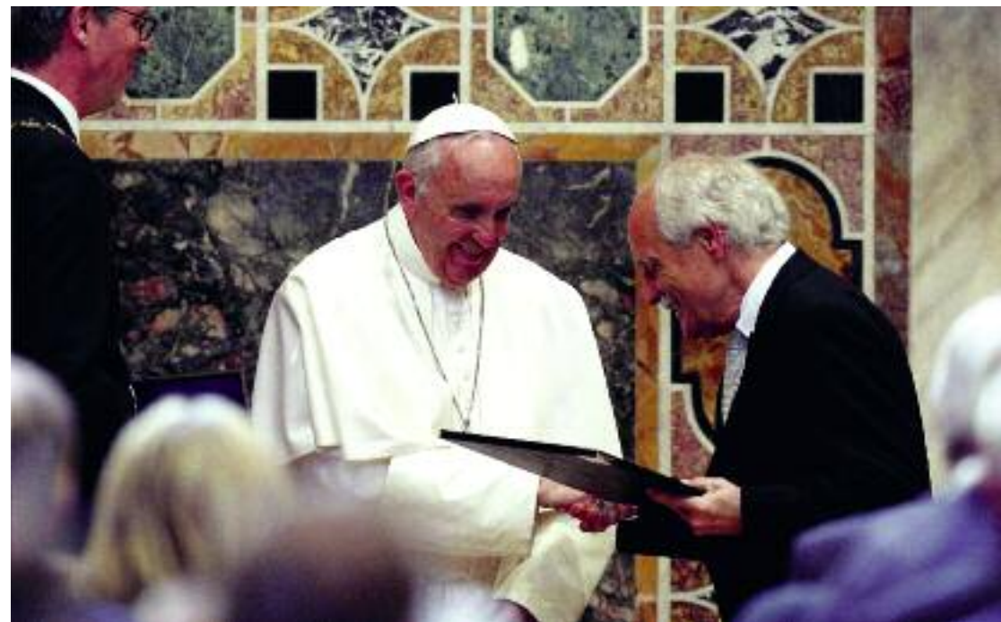
Στιγμιότυπο από την τελετή βράβευσης του πάπα Φραγκίσκου

Ονειρεύομαι μια Ευρώπη όπου τα ανθρώπινα δικαιώματα δεν είναι η τελευταία της ουτοπία.