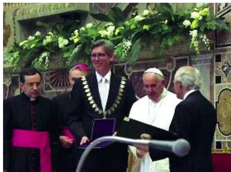
Στιγμιότυπο από την τελετή βράβευσης του πάπα Φραγκίσκου

Απευθυνόμενος στον πάπα Φραγκίσκο, ο κ. Μάρτιν Σουλτς ανέφερε, μεταξύ άλλων, στην ομιλία του: «Κάθε φορά μάς υπενθυμίζετε ότι η κλήση της ευρωπαϊκής οικοδόμησης παραμένει ένα ειρηνοποιό έργο για την ίδια την Ευρώπη και πέρα από αυτήν. Γιατί η δυστυχία του κόσμου δεν μπορεί να μας αφήνει αδιάφορους. Η δυστυχία του κόσμου είναι και δική μας υπόθεση. Ένας σταθερότερος κόσμος προϋποθέτει μια δυνατότερη Ευρώπη. Αυτό δεν ήταν και δεν θα είναι ποτέ εύκολο. Αλλά το να περιχαρακωνόμαστε στην ασφάλειά μας δεν είναι λύση. Ας ξαναβρούμε, λοιπόν, το θάρρος των προκατόχων μας, το θάρρος να αντιμετωπίσουμε τις δυσκολίες για να τις νικήσουμε, το θάρρος να μην υποκύψουμε στην ιστορία, αλλά να δημιουργήσουμε ιστορία, να είμαστε οι