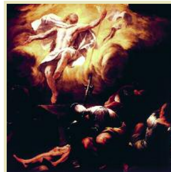
Resurrection by Luca Giordano

που μιλάμε για την ανάσταση ή για τους έσχατους καιρούς, μιλάμε με αποσπασματική μόνο γνώση. Είναι μια πραγματικότητα πέρα από την ανθρώπινη εμπειρία μας. Μόνο μέσα από τα ευαγγέλια και τα σχόλια των αγίων έχουμε κάποια γνώση, αλλά πάντα ατελή και αποσπασματική. Ας μην ζητάμε να γνωρίσουμε τα πάντα, κανείς δεν μπορεί να μας απαντήσει σε όλα.