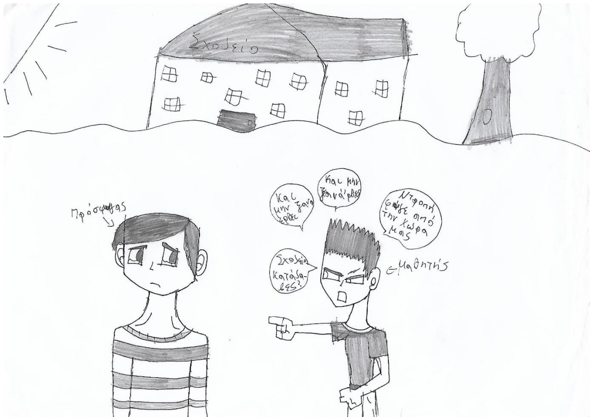
Ζωγραφιά μαθητή γυμνασίου