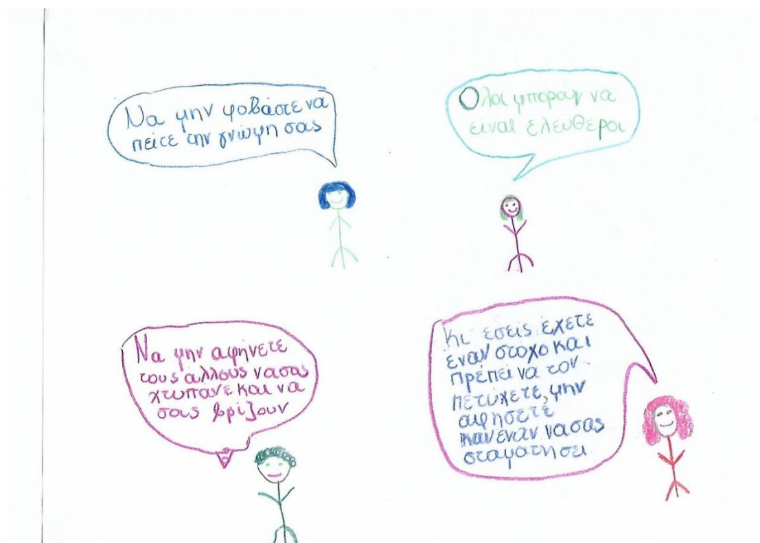
ζωγραφιά μαθητή δημοτικού