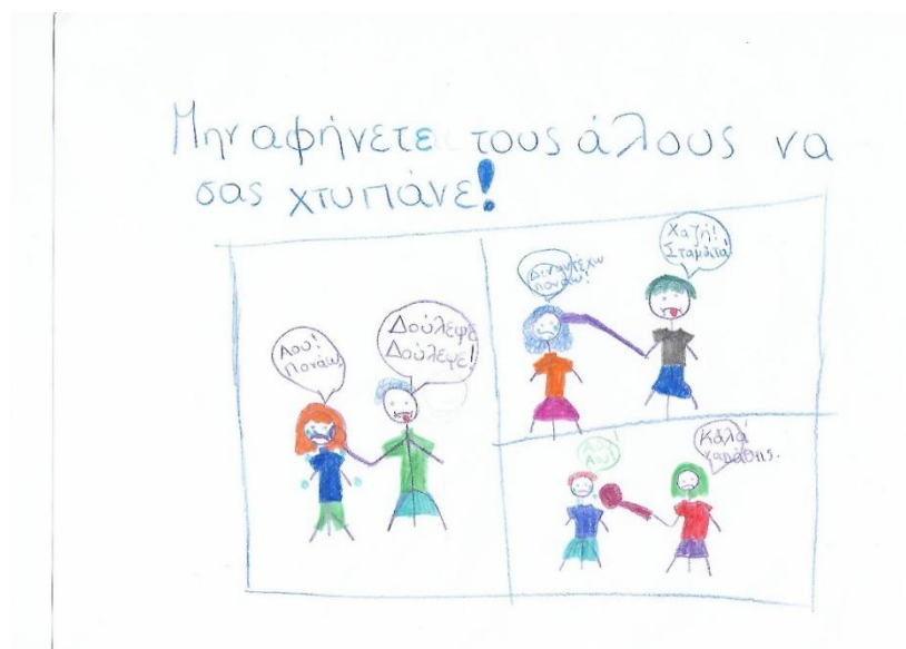
ζωγραφιά μαθητή δημοτικού

Από την πρώτη μέρα στο ελληνικό σχολείο όλοι με κοίταζαν με περίεργο βλέμμα, σαν να έβλεπαν κάποιον εχθρό τους. Κάθε μέρα με ρωτούσαν γιατί φοράω μαντήλα και μου έλεγαν να τη βγάλω. Εκείνη τη στιγμή αισθάνθηκα σαν να είμαι από άλλο πλανήτη. Αυτό κράτησε 9 μήνες. Τότε