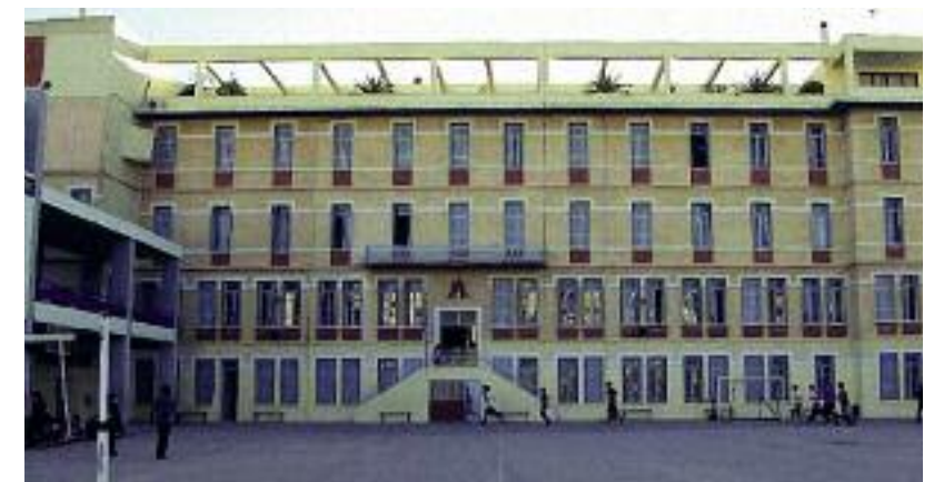
Η Λεόντειος Σχολή Αθηνών.

Η κατήχηση, κατ' αρχάς, είναι έργο της ενορίας. Στο σχολείο, κατά την ώρα των θρησκευτικών για τα καθολικά παιδιά, γίνεται πραγματικά σοβαρή δουλειά. Υπάρχει ένα πρόγραμμα που ακολουθείται κάθε χρονιά, χρησιμοποιούνται όλα τα βιβλία της Αρχιεπισκοπής, και όσοι διδάσκουν θρησκευτικά σε καθολικά παιδιά είτε είναι Μαριανό αδελφοί είτε λαϊκοί, είναι άρτια καταρτισμένοι, με σπουδές θεολογίας. Αντιμετωπίζεται πολύ σοβαρά το θέμα της διδασκαλίας θρησκευτικών, και τα παιδιά το καταλαβαίνουν. Μπορεί να δει κανείς ότι όσο μεγαλώνουν και ωριμάζουν, έχουν έναν ιδιαίτερο σεβασμό για ό,τι σχετίζεται με τον χριστιανικό και μαριανό χαρακτήρα του σχολείου. Επίσης, με τα νέα προγράμματα θρησκευτικών των Ορθόδοξων μαθητών, υπάρχει σε κάποιες περιπτώσεις η δυνατότητα συνδιδασκαλίας για κάποια χριστιανικά ζητήματα που δεν άπτονται των διαφορών μας, πράγμα που δημιουργεί ένα πολύ όμορφο κλίμα ανάμεσα στους μαθητές. Αυτό που μας ενδιαφέρει πολύ είναι η καλλιέρ-