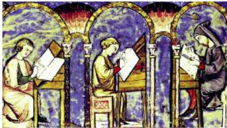
Αναπαράσταση του μεσαιωνικού Scriptorium. Μαδρίτη, Βιβλιοθήκη του San Lorenzo de El Escorial, 14ος αιώνας.

νομα, από πηγή μόλυνσης και ασθενειών, την μετέτρεπαν σε καλλιεργήσιμα εδάφη. Οφείλουμε την αγροτική αποκατάσταση μεγάλου μέρους της Ευρώπης στους μοναχούς, οι οποίοι φρόντιζαν και για την εκτροφή βοοειδών και αλόγων, για τη διατήρηση των δασών, καθώς και για τη φύτευση δέντρων. Ειδικά όσον αφορά τους Βενεδικτίνους μοναχούς, κάθε μοναστήρι ήταν και γεωργική σχολή για ολόκληρη την περιοχή. Οπουδήποτε κι αν πήγαιναν, εισήγαγαν καλλιέργειες ή μεθόδους παραγωγής που οι άνθρωποι εκεί δεν είχαν δει πριν. Αλλού εισήγαγαν τη μελισσοκομία, αλλού την παρασκευή μπίρας, γαλακτοκομικών προϊόντων και αλλού τη βελτίωση της αναπαραγωγής οικόσιτων ζώων. Αποθήκευαν νερό από πηγές, ώστε να το διανέμουν σε περιόδους ξηρασίας στους κατοίκους των γύρω περιοχών. Η Σουηδία οφείλει το εμπόριο καλαμποκιού στους μοναχούς, η Ιρλανδία την αλιεία σολομού, ενώ στη Λομβαρδία της Ιταλίας οι χωρικοί έμαθαν την άρδευση από τους μοναχούς. Στην Πάρμα παρασκευαζόταν τυρί, ενώ σε πολλά μέρη οι μοναχοί δημιούργησαν εξαιρετικούς αμπελώνες και ήταν πρωτοπόροι στην παραγωγή κρασιού και μπίρας.