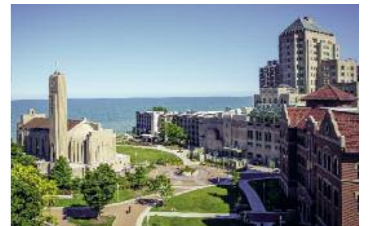
Το Πανεπιστήμιο των Ιησουιτών "Loyola" του Σικάγου.

Π αρόλο που πολύς κόσμος γνωρίζει γενικά ότι οι Βενεδικτίνιοι, προπάντων, μοναχοί εργάστηκαν για την διατήρηση μεγάλου μέρους της γραμματείας του αρχαίου κόσμου, δεν είναι αρκετά γνωστή η μοναστηριακή παράδοση και η ουσιαστική συμβολή της στην οικοδόμηση του δυτικού πολιτισμού. Οπωσδήποτε, τα μεσαιωνικά μοναστήρια συνέβαλαν στη διάνοηση και στον πολιτισμό, εντούτοις δεν μπορούμε να παραβλέψουμε τη σπουδαιότερη συμβολή τους στην καλλιέργεια των λεγόμενων πρακτικών τεχνών. Η χειρωνακτική εργασία είχε κεντρικό ρόλο στη μοναστική ζωή, καθώς η δύσκολη και καθόλου ελκυστική σωματική εργασία αποτελούσε για τους μοναχούς ένα μέσο απονέκρωσης της σάρκας και δίαυλο χάρης, ιδιαίτερα στις περιπτώσεις καθαρισμού και αποκατάστασης της γης. Οι μοναχοί αναπτύχθηκαν σε δύσκολες γεωγραφικά περιοχές, καθώς δέχονταν τις προκλήσεις που αυτές οι περιοχές προέβαλλαν. Αν μια βαλτώδης περιοχή δεν είχε καμία αξία, εκείνοι κατάφεραν να την αποστραγγίσουν και σύ-