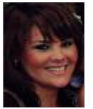
Επιμέλεια: Ειρήνη Κουτελάκη