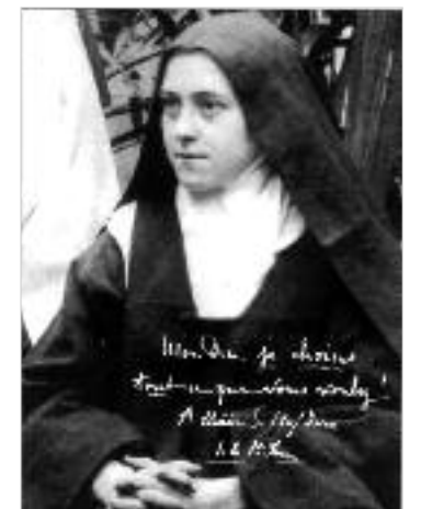
Αγία Τερέζα του Lisieux

Είχε εισέλθει στο μοναστήρι αποφασισμένη να γίνει αγία. Όμως έξι ολόκληρα χρόνια μετά την παραμονή της εκεί, συ-