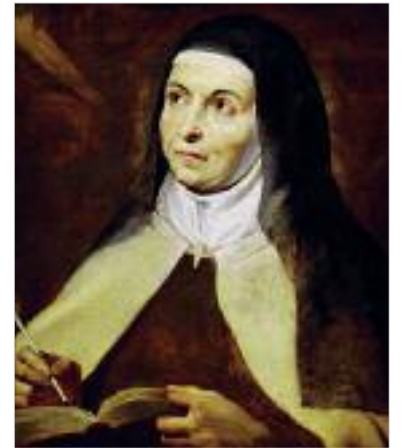
Αγία Τερέζα της Άβιλα

Όταν αφηγήθηκε σε άλλους τα οράματά της και τις πνευματικές εμπειρίες της, την απέτρεψαν από το να τις ακολουθήσει. Κατά συνέπεια, η πρόοδος στην πνευματική ζωή της Τερέζας έμεινε σχεδόν στάσιμη. Σε ηλικία 41 ετών, όμως, συνάντησε έναν ιερέα που την έπεισε να συνεχίσει στις προσευχές της και να ικετεύσει τον Θεό να επιστρέψει. Με τον καιρό, απορροφούσαν σε βαθιά ενατένιση, κατά την οποία ένιωθε μια αυξανόμενη αίσθηση ενότητας με τον Θεό. Λέγεται ότι κάποιες φορές το σώμα της αιωρούταν, ωστόσο στην ίδια την Τερέζα δεν άρε-