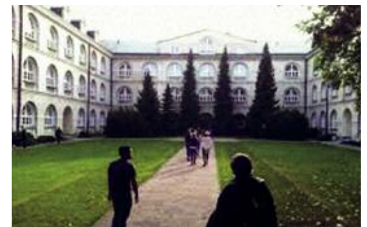
Το Καθολικό Πανεπιστήμιο του Λούμπλιν, Πολωνία.

Η Μπολόνια και το Παρίσι αποτέλεσαν πρότυπο για τους νέους εκπαιδευτικούς οργανισμούς που δημιουργούνταν, οι οποίοι ανα-