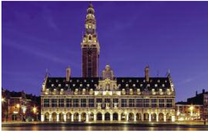
Η Κεντρική Βιβλιοθήκη του Καθολικού Πανεπιστημίου της Λουβαίν, Βέλγιο.

ζητούσαν προνόμια από τον πάπα ή τον πολιτικό ηγεμόνα. Πράγματι, λοιπόν, έγινε σύνηθες το καταστατικό των παπών να περιλαμβάνει μια καθορισμένη διατύπωση που χορηγούσε στο νέο πανεπιστήμιο «τα ίδια προνόμια, ασυλίες και ελευθερίες τις οποίες απολαμβάνουν οι καθηγητές και λόγιοι των Παρισίων» ή της Μπολόνια. Η Οξφόρδη και το Κέιμπριτζ κατά μεγάλο βαθμό διαμορφώθηκαν σύμφωνα με το Παρίσι. Η Γλασκώβη σύμφωνα με την Μπολόνια. Τον τύπο των Παρισίων ακολούθησαν τα πρώιμα γερμανικά πανεπιστήμια, η Πράγα, η Βιέννη και άλλα πανεπιστήμια, που όμως σύντομα απέκλιναν από τον αρχικό τύπο. Ως πρυτάνεις των πανεπιστημίων επιλέγονταν καθηγητές από οποιαδήποτε πανεπιστημιακή σχολή, ενώ τα κολέγια παρέμεναν υπό τον έλεγχο του πανεπιστημίου, που κρατούσε στα δικά του χέρια την εκπαίδευση. Από την άλλη πλευρά, στην Ιρλανδία τα πρώτα βήματα για την καθιέρωση πανεπιστημίου έγιναν από τον Αρχιεπίσκοπο Δουβλίνου το 1320, που ίδρυσε ένα πανεπιστήμιο στον Καθεδρικό ναό του αγίου Πατρικίου, με έγκριση από τον πάπα Ιωάννη ΚΒ'.