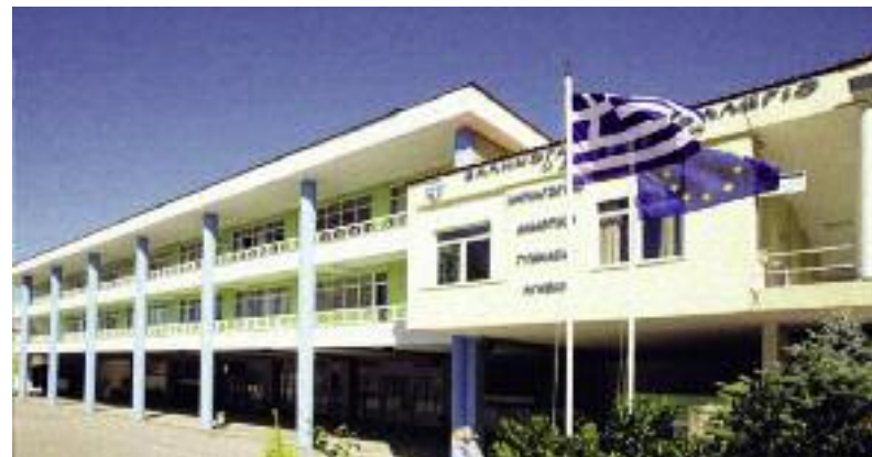
Το Κολέγιο "ΔΕΛΑΣΑΛ"

Σίγουρα έχουν εξελιχθεί πολύ, ιδιαίτερα τα τελευταία χρόνια, ώστε να προσαρμοστούν στην εποχή τους και να ανταποκριθούν στις απαιτήσεις της εποχής τους. Σήμερα οι ανάγκες είναι διαφορετικές απ' ό,τι πριν από είκοσι χρόνια. Εδώ όμως μπαίνει η έννοια της διάκρισης: πρέπει να ξεχωρίσεις τι πρέπει να παραμείνει αυτούσιο και τι έχει να κάνει με την εξέλιξη κάθε εποχής, τι πρέπει να αλλάξει για να συμβαδίζει με τις απαιτήσεις του σήμερα. Αυτό είναι κάτι για το οποίο αναρωτιόμαστε διαρκώς, και σε επίπεδο επαρχίας, και σε ολόκληρο το τάγμα. Ενδιαφερόμαστε πολύ να είναι επίκαιρο το μήνυμά μας και να απαντάει στις ανάγκες των νέων του σήμερα. Μια φράση που είναι σημάδιακή, που την είχε πει ο Γενικός Ηγούμενος των Μαρσιανών, ότι για πολλά παιδιά, η μοναδική επαφή που θα έχουν με την Εκκλησία θα είναι διαμέσου των σχολείων μας. Αυτό είναι και μια πολύ μεγάλη ευθύνη, γιατί το πρόσωπο της Εκκλησίας που τα παιδιά θα γνωρίσουν μέσω ημών, θα τα επηρεάσει και είναι αυτό που θα κληθούν