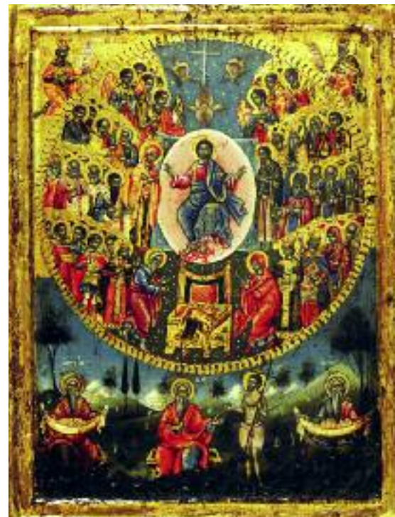
Οι Άγιοι Πάντες. Εικόνα του 18ου αιώνα.

Αλλά αυτή την προσωπική αυθεντία του, την στηρίζει στο γεγονός ότι ταυτίζει, ως Υιός, τον εαυτό του με τον Πατέρα. Συνεπώς, όταν δηλώνει κάτι στο όνομά του -π.χ. «Ακούσατε ότι ειπώθηκε παλιά: μη φονεύσεις. Εγώ σας λέω ότι όποιος δει κάποιον και τον μισήσει, ήδη τον έχει φονεύσει στην καρδιά του»- αυτό είναι κάτι εντελώς καινούργιο στη θρησκεία του Ισραήλ. Δεν το βρίσκει κανείς ούτε στους προφήτες, οι οποίοι ρητά παραπέμπουν στον Θεό ως αποστολέα, ούτε, πολύ περισσότερο, στους ραβίνους, τους δασκάλους της εποχής του Ιησού. Αλλά εκείνο το «Εγώ σας λέω», προέρχεται από τον Θεό, δεν είναι ξεκομμένο από Εκείνον. Από την άποψη αυτή, η διδασκαλία του Χριστού έχει κάτι το καινούργιο. Όταν κανείς διδάσκει, το θέμα του είναι εν ονόματι ποιού διδάσκει. Ο Χριστός διδάσκει εν ονόματι του εαυτού του και είναι αυτό που είχε καταπλήξει τους ακροατές του όταν τον άκουγαν. Πρώτα απ' όλα το περιεχόμενο αυτού το οποίο τους πρότεινε ως διδασκαλία, αλλά και το γεγονός ότι το πρότεινε προσωπικά, που είναι το λεγόμενο «μεσσιανικό εγώ» του Ιησού Χριστού.